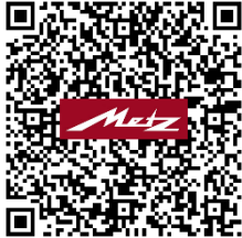
Datenschutzerklärung für Smart-TV

Über den folgenden QR-Code kann die aktuelle Datenschutzerklärung für Smart-TV abgerufen werden.